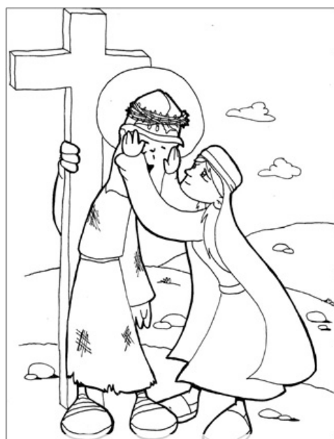
6º ESTACIÓN: LA VERÓNICA ENJUGA EL ROSTRO DE JESÚS