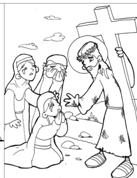
8º ESTACIÓN: JESÚS CONSUELA A LAS MUJERES DE JERUSALÉN