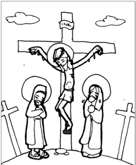
12º ESTACIÓN: JESÚS MUERE EN LA CRUZ