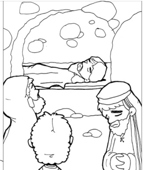
14º ESTACIÓN: JESÚS ES SEPULTADO