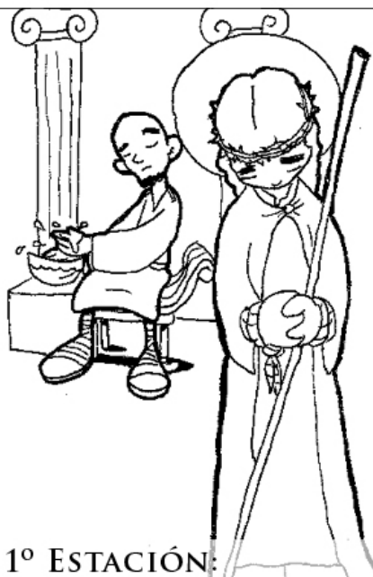
1º ESTACIÓN: JESÚS ES CONDENADO