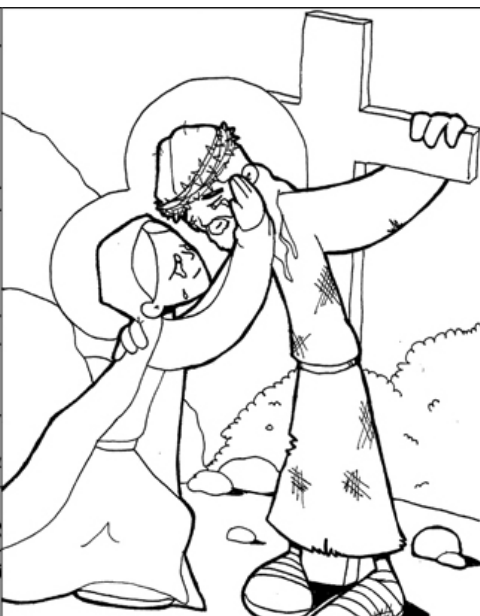
4º ESTACIÓN: JESÚS SE ENCUENTRA CON SU MADRE