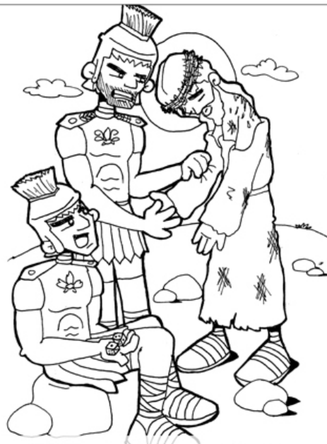
10º ESTACIÓN: JESÚS ES DESPOJADO DE SU ROPA