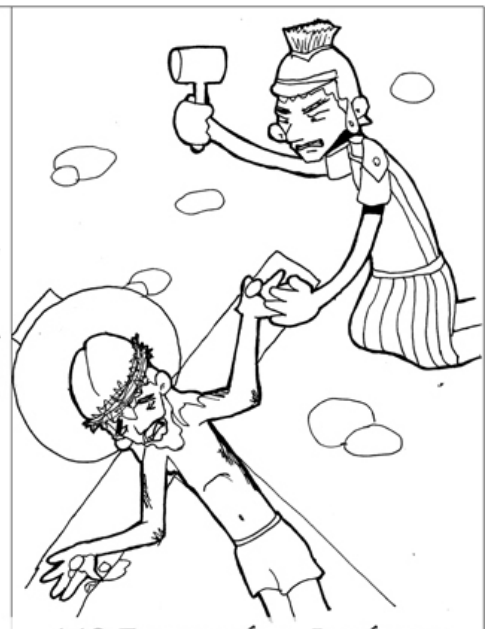
11º ESTACIÓN: JESÚS ES CLAVADO EN LA CRUZ