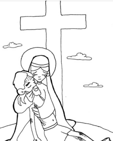
13º ESTACIÓN: JESÚS ES BAJADO DE LA CRUZ