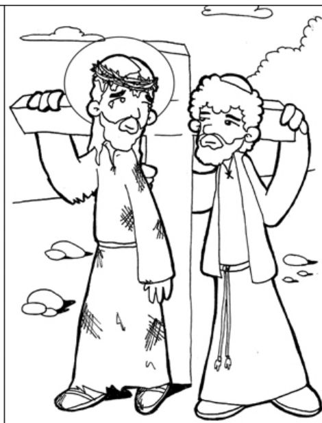
5º ESTACIÓN: EL CIRENEO AYUDA A JESÚS A CARGAR LA CRUZ