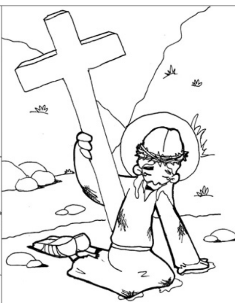
7º ESTACIÓN: JESÚS CAE POR SEGUNDA VEZ