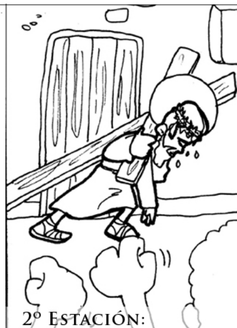
2º ESTACIÓN: JESÚS CARGA LA CRUZ