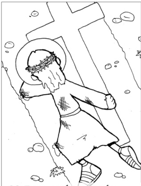
9º ESTACIÓN: JESÚS CAE POR TERCERA VEZ